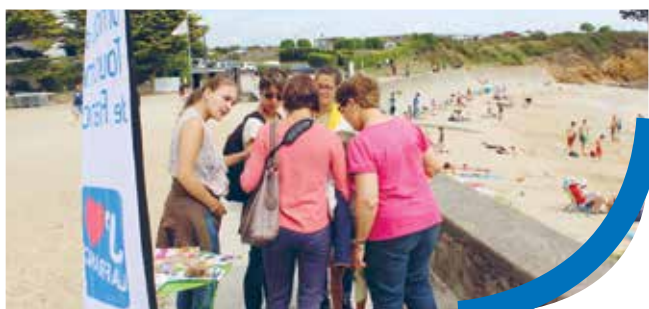
Accueil hors les murs - Port - La Roche-Bernard

L'Office de Tourisme a aussi testé l' accueil hors les murs en se déplaçant sur les ports de Pénerf, La Roche-Bernard, les plages de Damgan et Billiers. Un essai concluant, avec des estivants demandeurs d'informations diverses, pour des échanges pleins de convivialité avec nos conseillers en séjour. Les 3 bureaux ont enregistré une forte progression de leur fréquentation au mois d'avril (+ 40%) grâce à un superbe ensoleillement, un