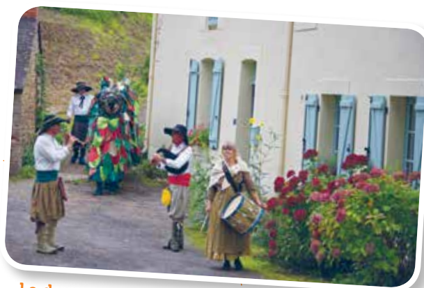
La drague et ses musiciens