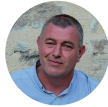
Bruno Le Borgne Maire

Le conseil d'installation a eu lieu le 25 mai. Depuis, 2 conseils se sont tenus à huis clos suite à la crise sanitaire les 8 et 29 juin. Les comptes-rendus des conseils municipaux sont mis à disposition sur le site de la mairie après validation du compte-rendu par le conseil municipal (lors du conseil municipal suivant).